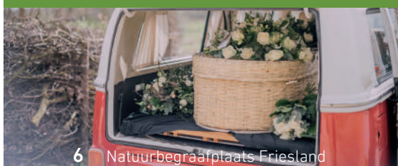
6 Natuurbegraafplaats Friesland

Als u ervoor kiest om na een crematie begraven te worden, houdt u dan rekening met de kosten voor de crematie en daarna de kosten van het natuurgraf. De kosten voor een urnengraf zijn wel lager, waardoor het verschil weer minder groot wordt. Een urn mag, maar de as hoeft niet in een biologisch afbreekbaar omhulsel begraven te worden; het mag ook in een urnengraf gestrooid worden. Uitstrooien op de bosbodem is niet toegestaan omdat het de bodem verrijkt met calcium en fosfaat, waardoor dominante ruigtesoorten zoals de brandnetel gaat overheersen en bloemrijke vegetatie geen kans krijgt.